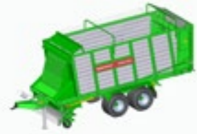
ROYAL 260 S