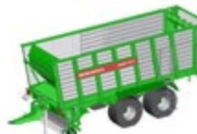
CAREX 370 S