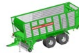
SHUTTLE 370 S