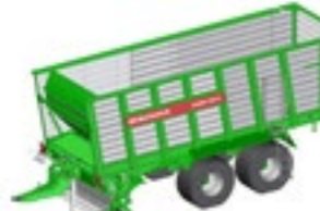
CAREX 390 K