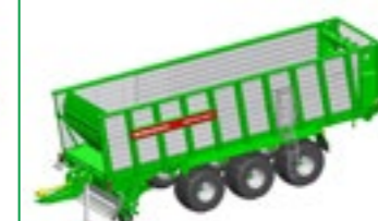
SHUTTLE 490 S