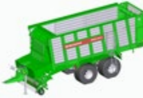
REPEX 340 S