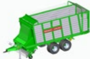
ROYAL 280 K