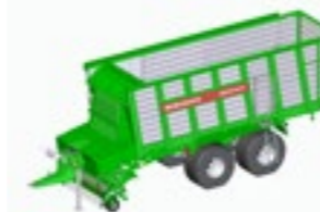
REPEX 360 K