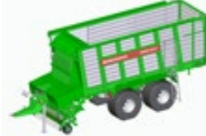
REPEX 320 K