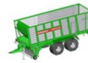
SHUTTLE 390 K