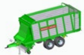
ROYAL 300 K