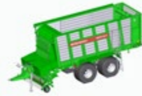
REPEX 300 S