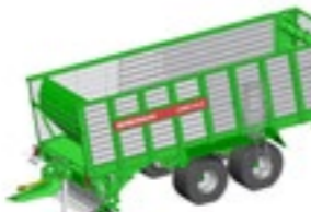
CAREX 410 S