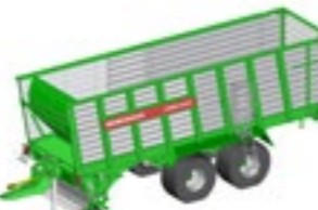
CAREX 430 K