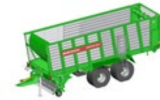
SHUTTLE 410 S