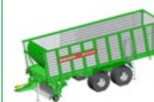
SHUTTLE 470 K