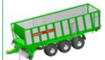
SHUTTLE 510 K