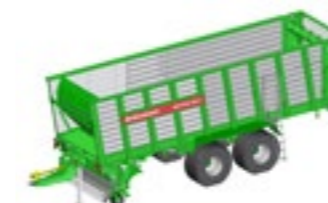
SHUTTLE 450 S