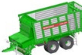
CAREX 330 S