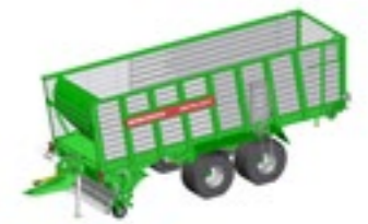
SHUTTLE 430 K