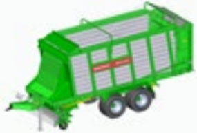
ROYAL 280 S