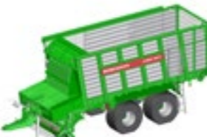
CAREX 350 K