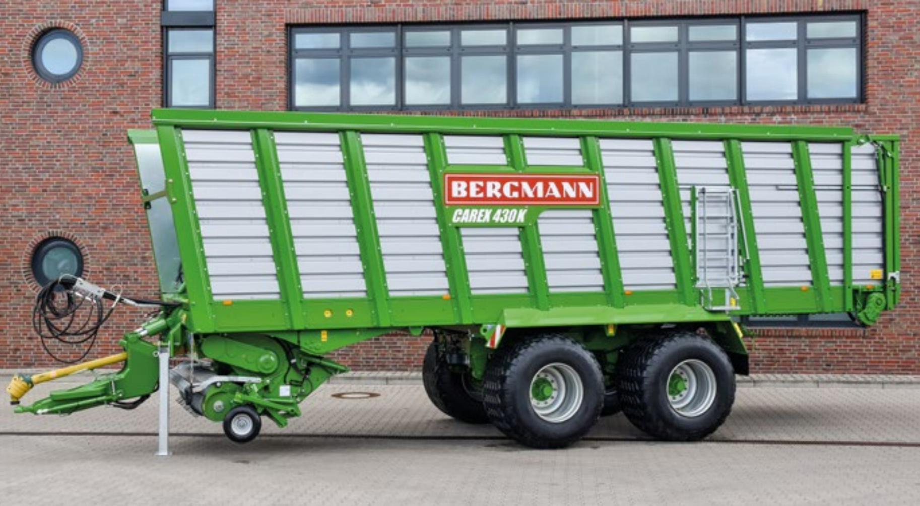
41 Messer in einer Ebene, 35 mm Schnittlänge