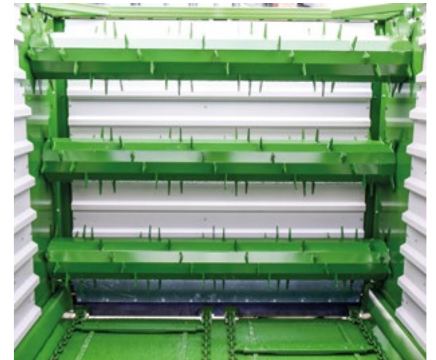
Beidseitiger Transportbodenantrieb mit Eilgangschaltung