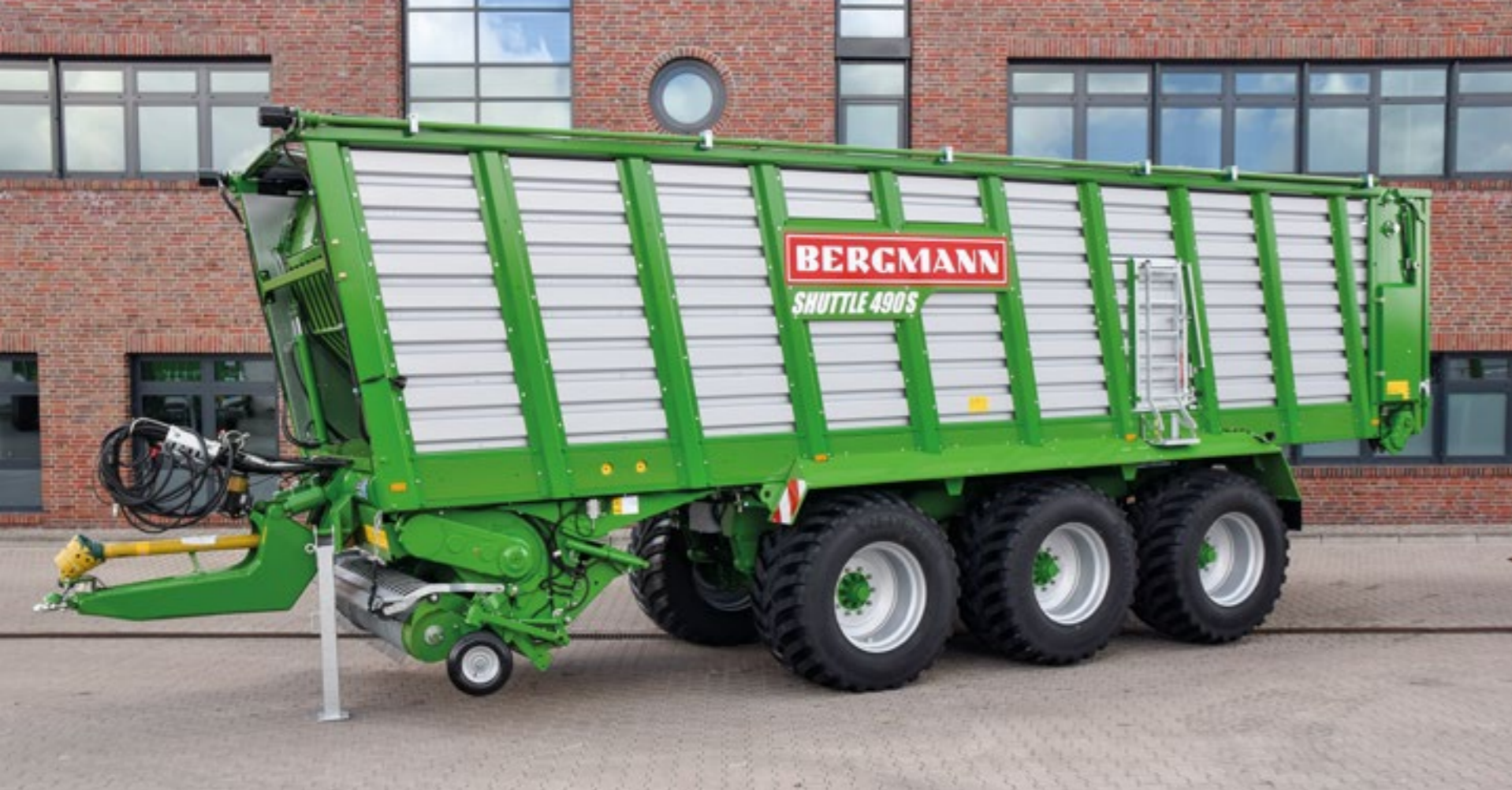
53 Messer in einer Ebene, 34 mm Schnittlänge