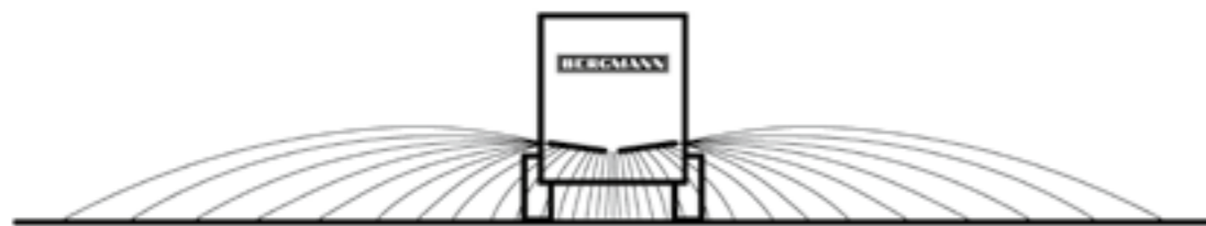
Streubild mit V Spread