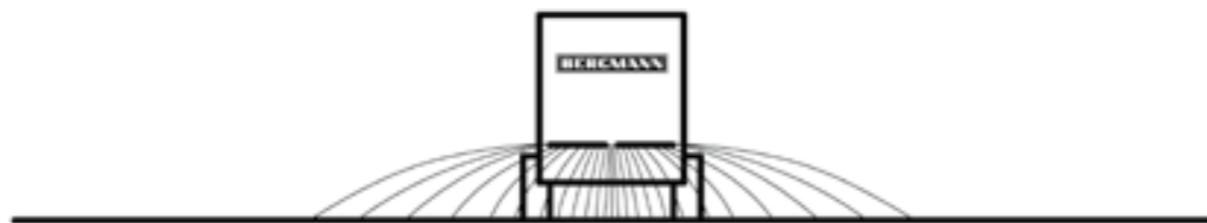
Streubild mit Standard-Streuerwerk