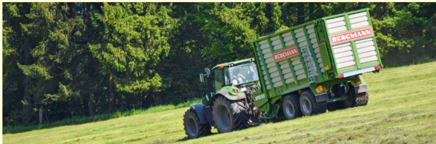
Разбрасыватель органических удобрений – Универсальный прицеп – разбрасыватель – Подборщик – измельчитель